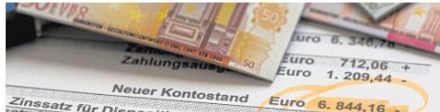
Beratungsfälle nach Alter

Grund und Basis allen Übels ist laut Bericht die hohe Armutsquote in Herne, die private Überschul-